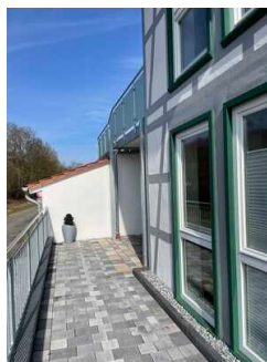
Eingang Terrasse Melkkutscher