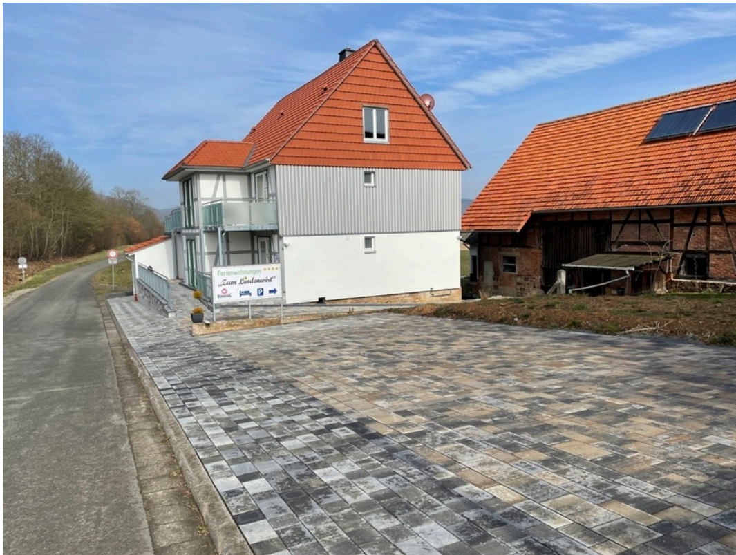
Ferienwohnungen Zum Lindenwirt